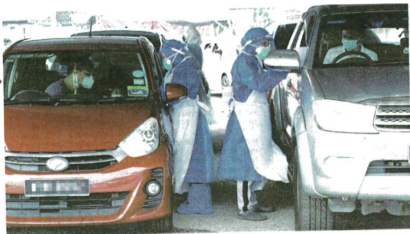
PETUGAS kesihatan memeriksa orang ramai yang hadir di Pusat Penilaian Covid-19 di Pusat Dagangan Antarabangsa Melaka, Ayer Keroh kelmarin.

AKHBAR : KOSMO MUKA SURAT : 4 RUANGAN : NEGARA