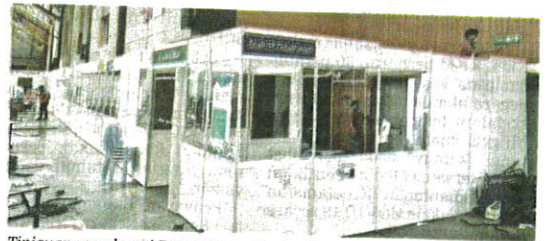
Tinjauan mendapati Pusat Kuarantin dan Rawatan COVID-19 Bersepadu (PKRC) 2.0 di Taman Ekspo Pertanian Malaysia (MAEPS) ditutup.