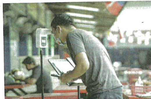
PEMANSUHAN SOP pemeriksaan suhu di premis dilaksanakan dengan mengambil kira pandangan KKM. - GAMBAR HIASAN

"Mewajibkan dos penggalak, membenarkan menjalani kuarantin wajib di tempat kediaman tanpa memohon kelulusan pihak berkuasa,"ujarnya.