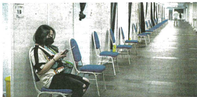
SUASANA lengang ketika pemberian dos penggalak di Pusat Pemberian Vaksin (PPV) Axiata Arena Bukit Jalil yang kurang mendapat sambutan orang ramai, semalam.

Pada masa sama, beliau menyarankan pakar Kementerian Kesihatan Malaysia (KKM) agar aktif bekerjasama dengan media untuk membuat hebahan secara berkesan tentang keperluan suntikan