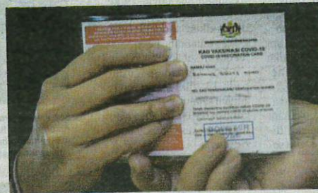
Cadangan tersebut sebagai maklum balas keyakinan rakyat terhadap kerajaan khususnya KKM.

"Saya dengan ini mohon menandatangani surat yang mengahang tuntutan ganti rugi sebaliknya KKM memberi jaminan bayaran pampasan jika berlaku kesan buruk kesihatan pada penerima," katanya