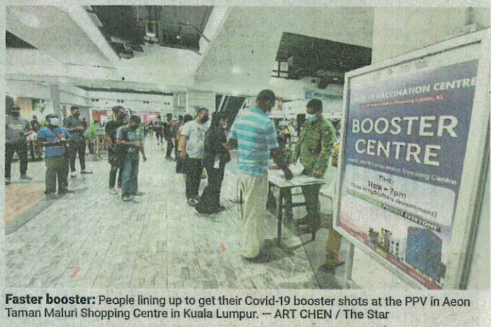
Faster booster: People lining up to get their Covid-19 booster shots at the PPV in Aeon Taman Maluri Shopping Centre in Kuala Lumpur.

A study published in The Lancet journal on the United Kingdom's Covid-19 booster trials stated that people who received vaccine boosters that differed from their initial vaccines recorded higher levels of immunity.